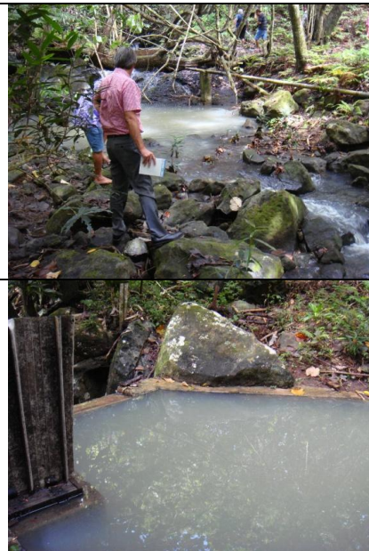
Visite du site de captage de la Tuarani