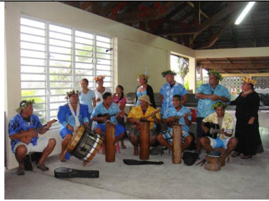
Accueil chaleureux à l'aérodrome de Raivavae