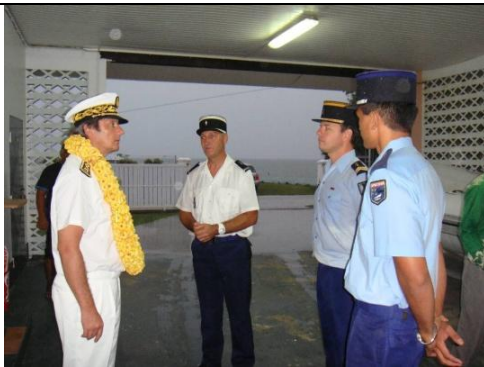
Visite à la brigade de gendarmerie de Raivavae