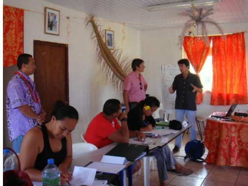
Le chef de la subdivision administrative des îles Australes en présence du maire de la commune de Raivavae, du formateur du SEFI et des stagiaires dans le cadre de la formation « création d'entreprises »