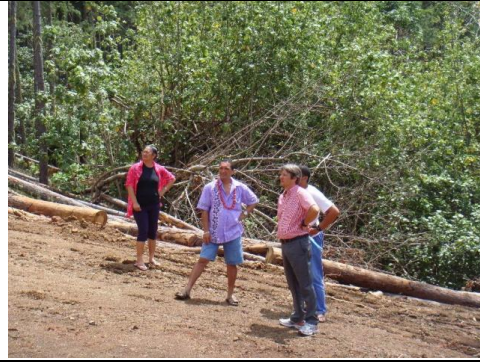
Visite du site du futur réservoir d'eau potable