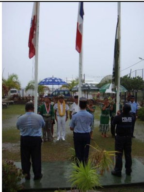
Levée des couleurs à la mairie de Rairua