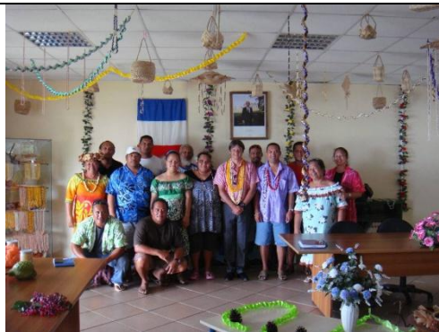
Photo de famille avec les élus municipaux et les cadres de la commune de Raivavae